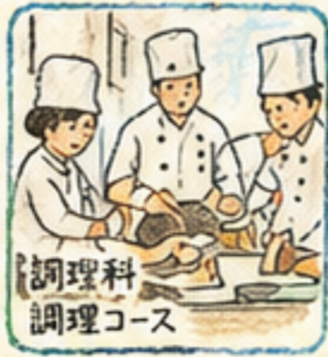
調理科 調理コース