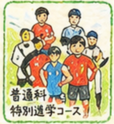
普通科 特別進学コース