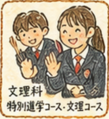
文理科 特別進学コース・文理コース