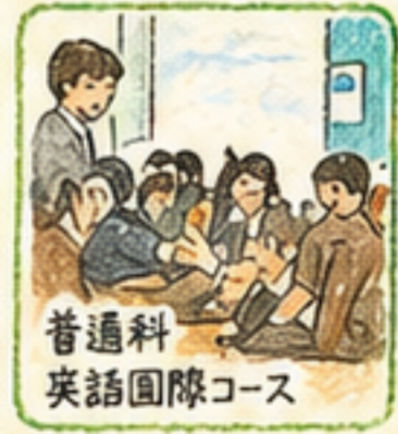
普通科 英語国際コース