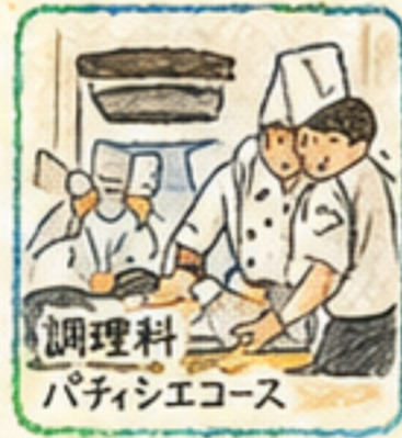
調理科 パティシエコース