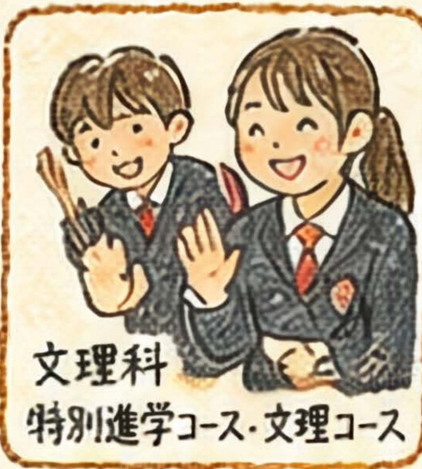
文理科 特別進学コース・文理コース