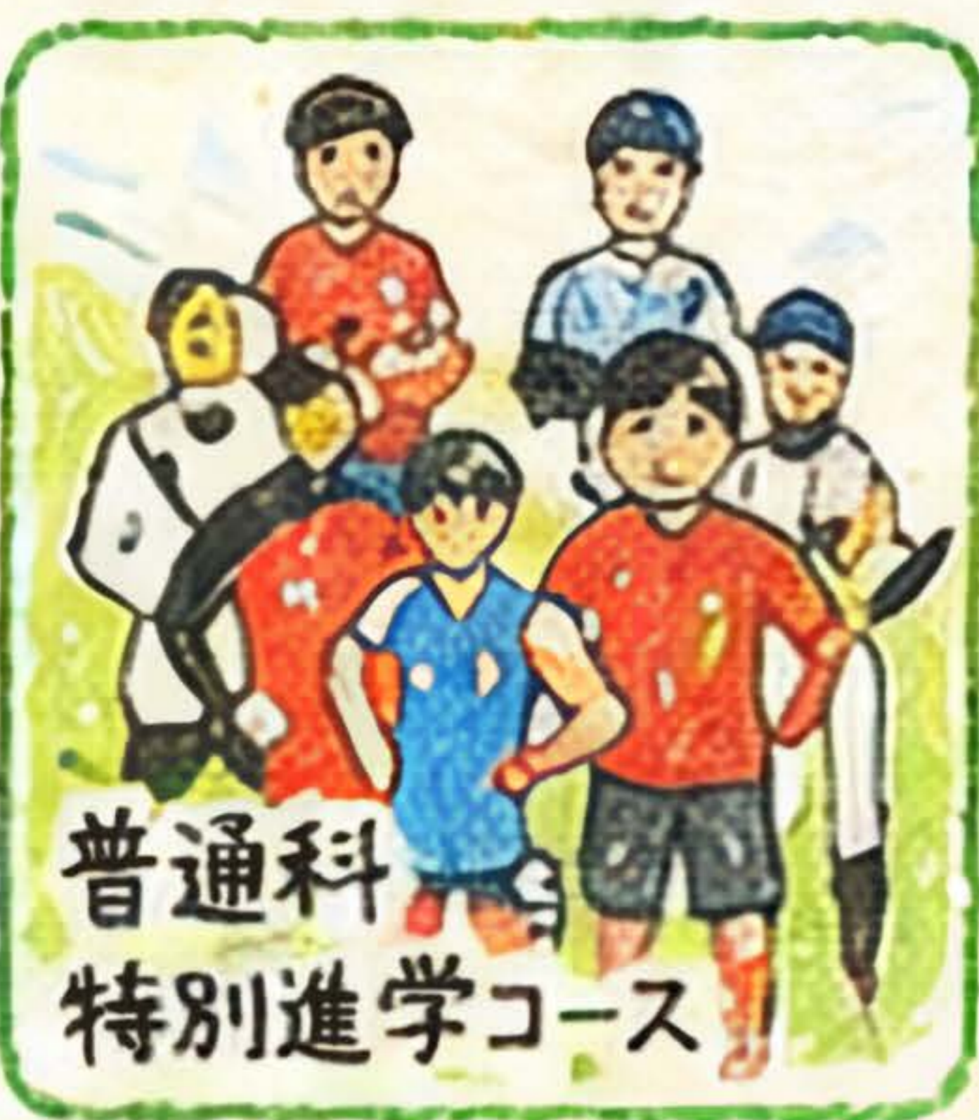
普通科 特別進学コース