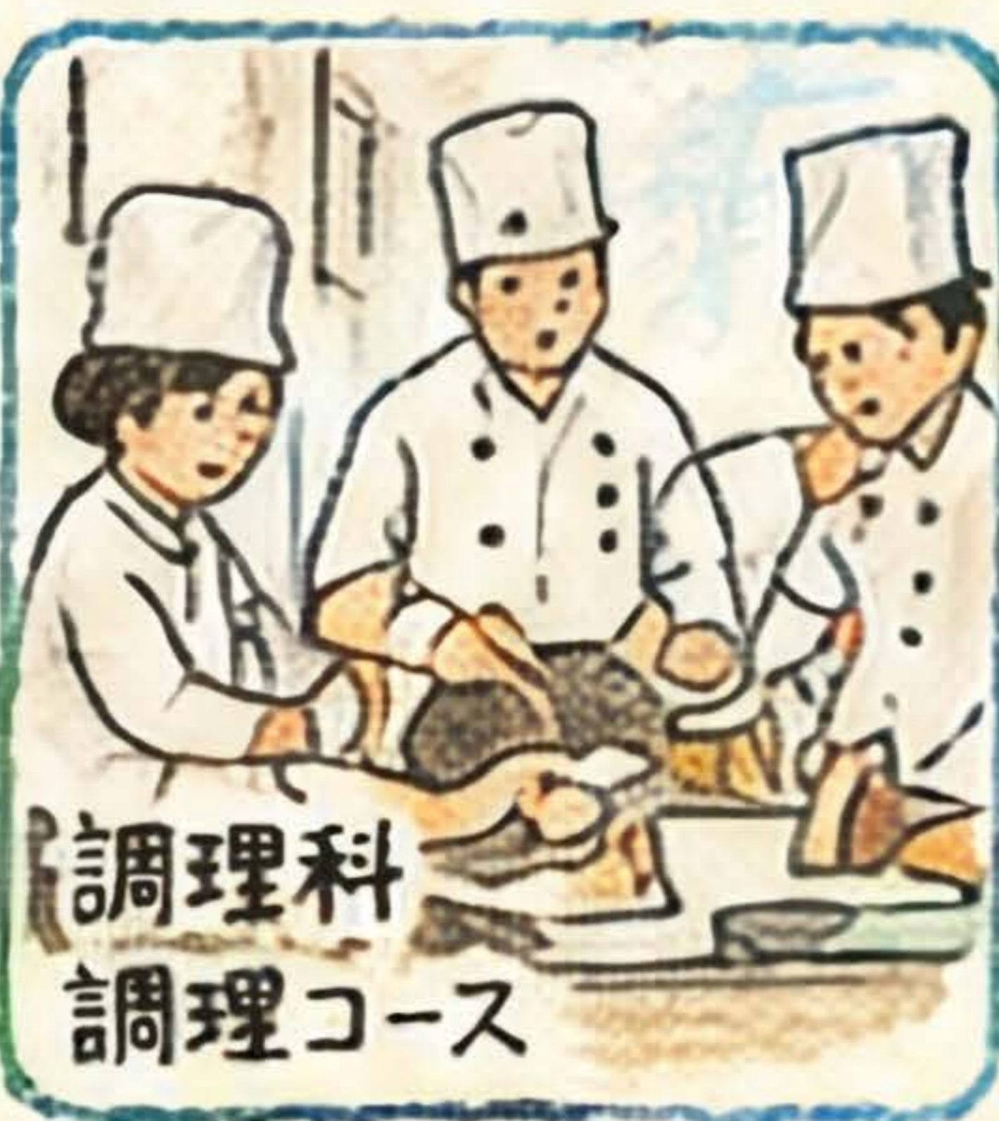
調理科 調理コース