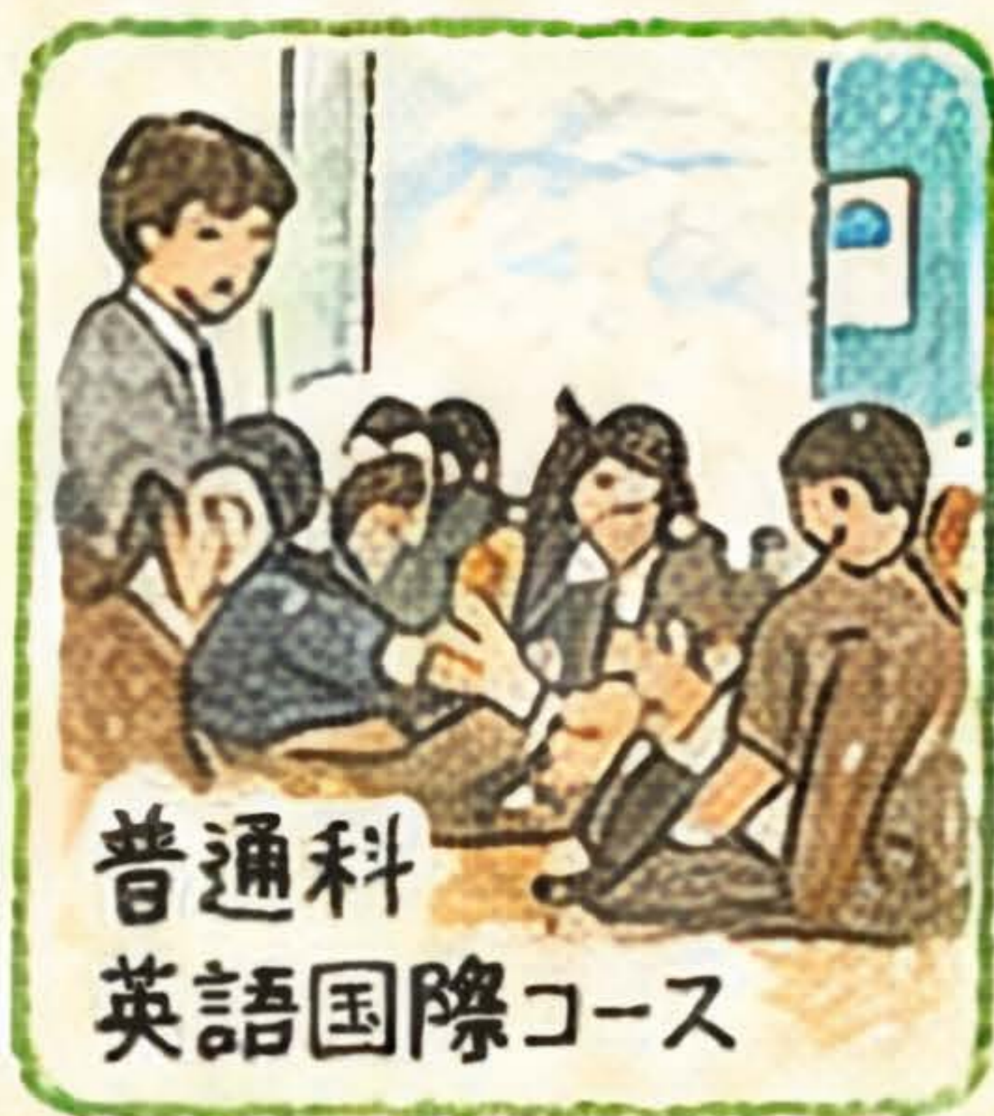
普通科 英語国際コース