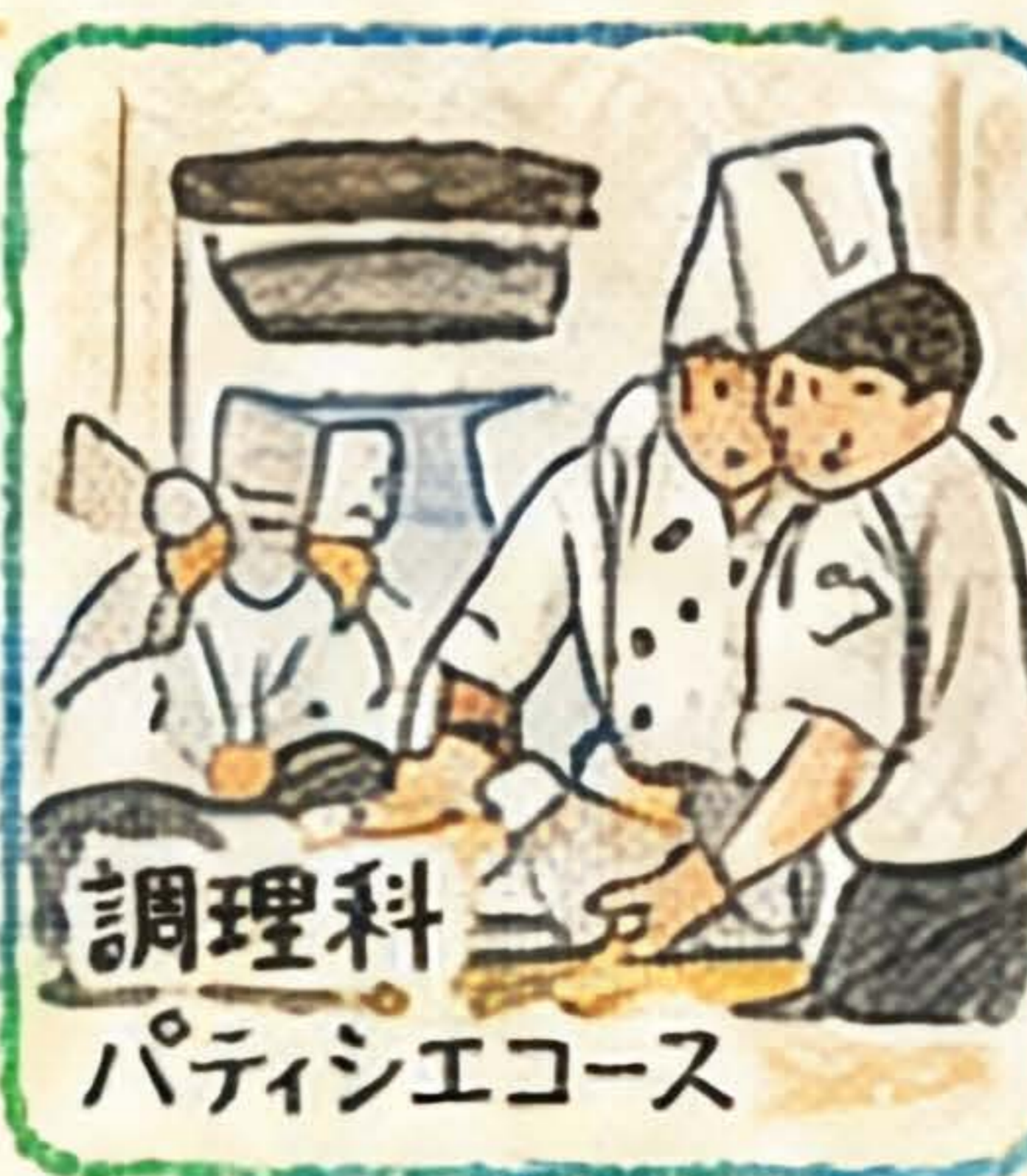
調理科 パティシエコース