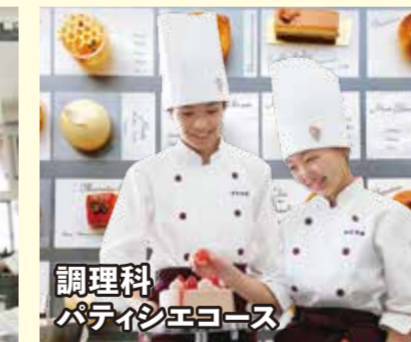
調理科 パティシエコース