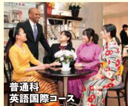
普通科 英語国際コース