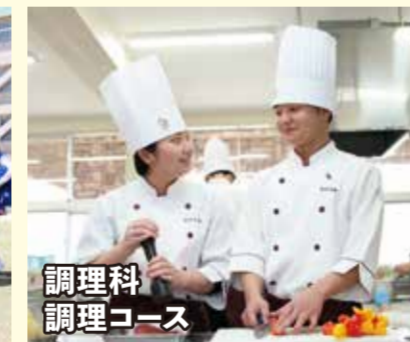
調理科 調理コース