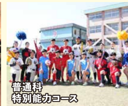
普通科 特別能力コース