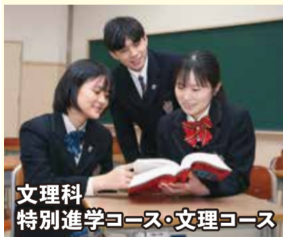
文理科 特別進学コース・文理コース